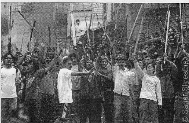
Demonstranten der Volksbewegung am 2. Tag des Aufstandes

– Fortgesetzte Diskriminierung der Frauen sowohl in der Verfassung und in zahlreichen nachgeordneten Ge-