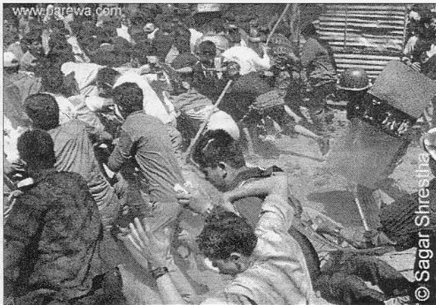
Straßenschlacht zwischen Demonstranten und Polizei

2006 waren die Konzepte und Ziele der SPA wesentlich konkreter und weitreichender als 1990 die gemeinsamen Ziele von Nepali Congress und United Left Front. Letztere hatten sich lediglich auf die Abschaffung des königlichen Panchayat-Systems und die Einführung eines demokratischen Staatswesens geeinigt. Diesmal basierten die Ziele der SPA auf dem Abkommen mit den Maoisten, das eine Beendigung aller direkten königlichen Machtanmaßungen, möglicherweise gar eine Ende der Monarchie an sich umfaßte. Außerdem beinhalteten die Forderungen der Parteien die Schaffung einer neuen Verfassung durch eine vom Volk gewählte verfassungsgebende Versammlung. Letzteres war 1990 zumindest mit dem Nepali Congress nicht machbar gewesen. Der dritte wichtige Punkt von 2006 betraf einen Friedensprozeß mit den Maoisten, u. z. nicht durch Einsatz von Waffengewalt, wie vom König und den USA befürwortet, sondern durch einen friedlichen Dialog und eine Beteiligung der Maoisten am Aufbau des zukünftigen politischen Systems, in welchem die Maoisten folglich zumindest ihre wichtigsten Forderungen verwirklicht sehen mußten.