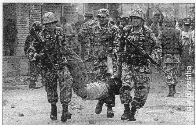
Soldaten tragen einen verletzten Demonstranten