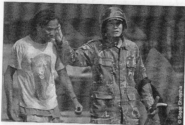
Ein Demonstrant wird gemäßigelt

Der Putsch Gyanendras vom 1. Februar 2005 war nur möglich, weil die Sicherheitskräfte, insbesondere die Armeeführung, geschlossen hinter dem Monarchen stand. Die Verfassung von 1990 verlangte von den Streitkräften nämlich nicht Loyalität gegenüber dem Volk sondern gegenüber dem König. Eine weitere Voraussetzung des Putsches war die Unterdrückung zahlreicher von der Verfassung garantierter Grundrechte. Selbständiges Denken und kritische Meinungsäußerungen waren fortan ähnlich verboten wie in den Zeiten des Panchayat-Systems (1961–90). Journalisten, Akademiker, Studenten, Menschenrechtler und sonstige Mitglieder der zivilen Gesellschaft sahen sich nach dem 1. Februar 2005 ständigen Repressalien, Verhaftungen, Foltermaßnahmen und gar der Bedrohung von Leib und Leben ausgesetzt. Daß sich dennoch gerade in den ersten Monaten nach dem königlichen Putsch eine Bewegung der zivilen Gesellschaft herausbildete, die in den Folgemonaten enormen Druck auf den König, seine illegitime Regierung und seine Armee, aber auch auf die politischen Parteien und die Maoisten ausübte, ist ein weiterer Beweis dafür, daß das politische System von 1990 trotz seiner zahlreichen Unzulänglichkeiten begonnen hatte, Früchte zu tragen. (Die Rolle der zivilen Gesellschaft in Hinsicht auf die Volksbewegung von 2006 beschreibt Florian Kollmann in einem nachfolgenden Beitrag)